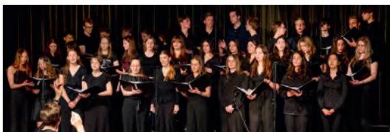
Grosses Freifachangebot, z.B. Chor.