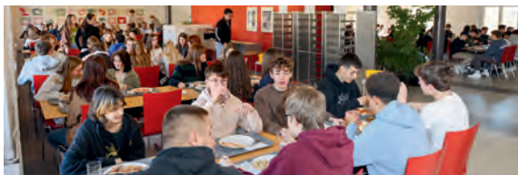
Alle Schülerinnen und Schüler essen gemeinsam in der Mensa.