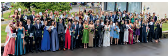
Maturae und Maturi freuen sich über das Reifezeugnis.