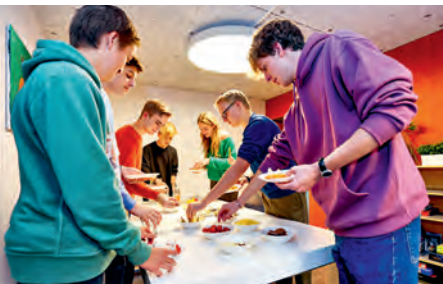
«Night-Food» für den kleinen Hunger.

Die Internen sind vollständig in die Tagesschule integriert und unterscheiden sich nicht von den externen Tagesschülerinnen und -schülern. Den Abend und die Nacht verbringen sie im Internatsgebäude, das Barralhaus heisst.