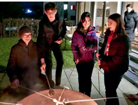
Feuerschale im Internatsgarten.

Die Schüler/-innen der 5. und 6. Klassen wohnen wenn möglich in Einzelzimmern. Sie legen innerhalb klarer Regeln und Richtlinien ihre Tagesstruktur selber fest und werden dabei von professionellen Ansprechpersonen unterstützt.