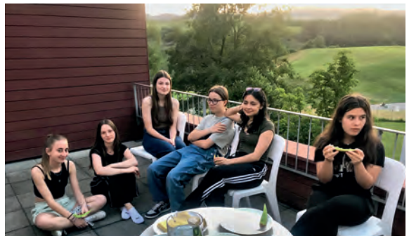
Auf der Dachterrasse.